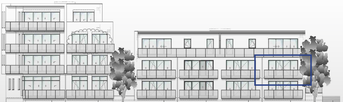
Ansicht von Westen