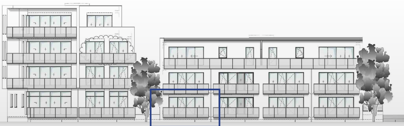
Ansicht von Westen